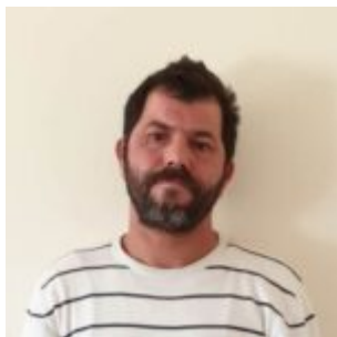
Sebastiano Violante