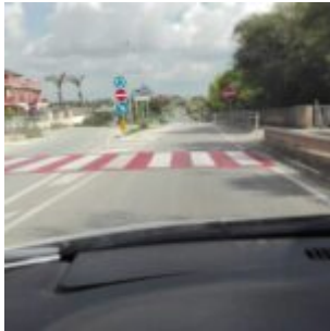
Prov. di Ragusa