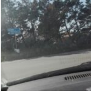
Prov. di Siracusa