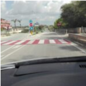
Prov. di Ragusa