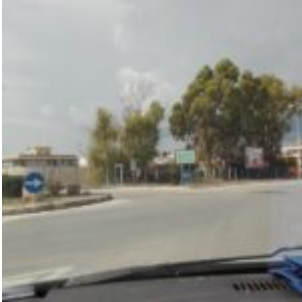
Prov. di Ragusa