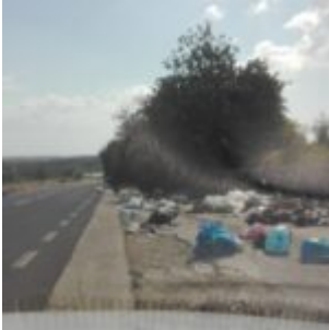
Prov. di Siracusa