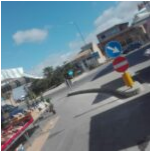
Prov. di Ragusa