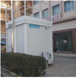
la centralina Teracati