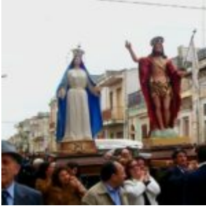
A Noto, la processione della Spina Santa.