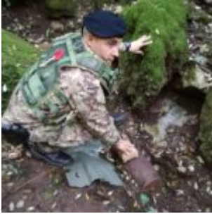
L'ESERCITO INTERVIENE IN SICILIA