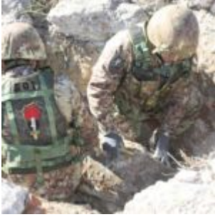
L'ESERCITO INTERVIENE IN SICILIA